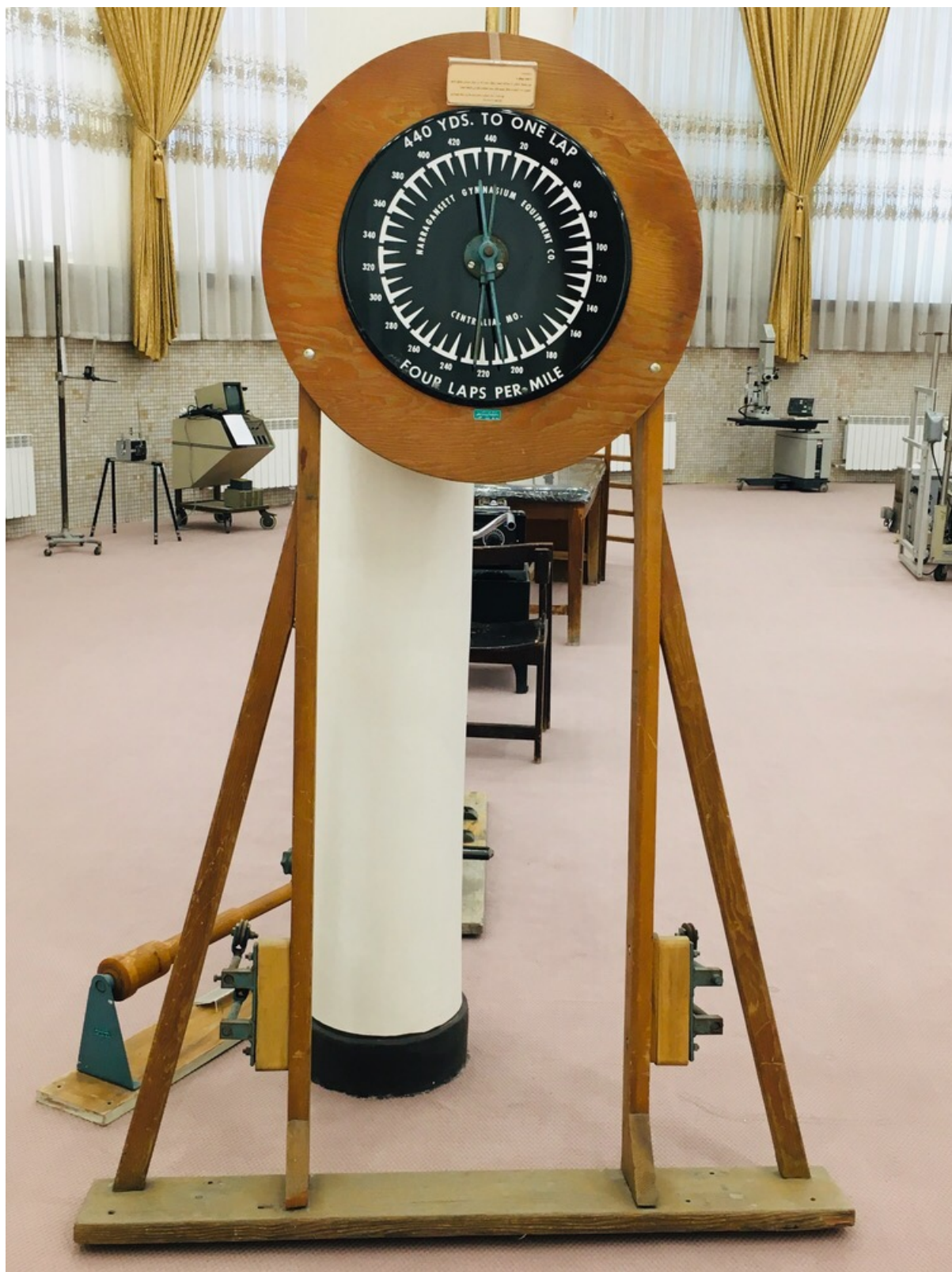
دستگاه تست ورزش