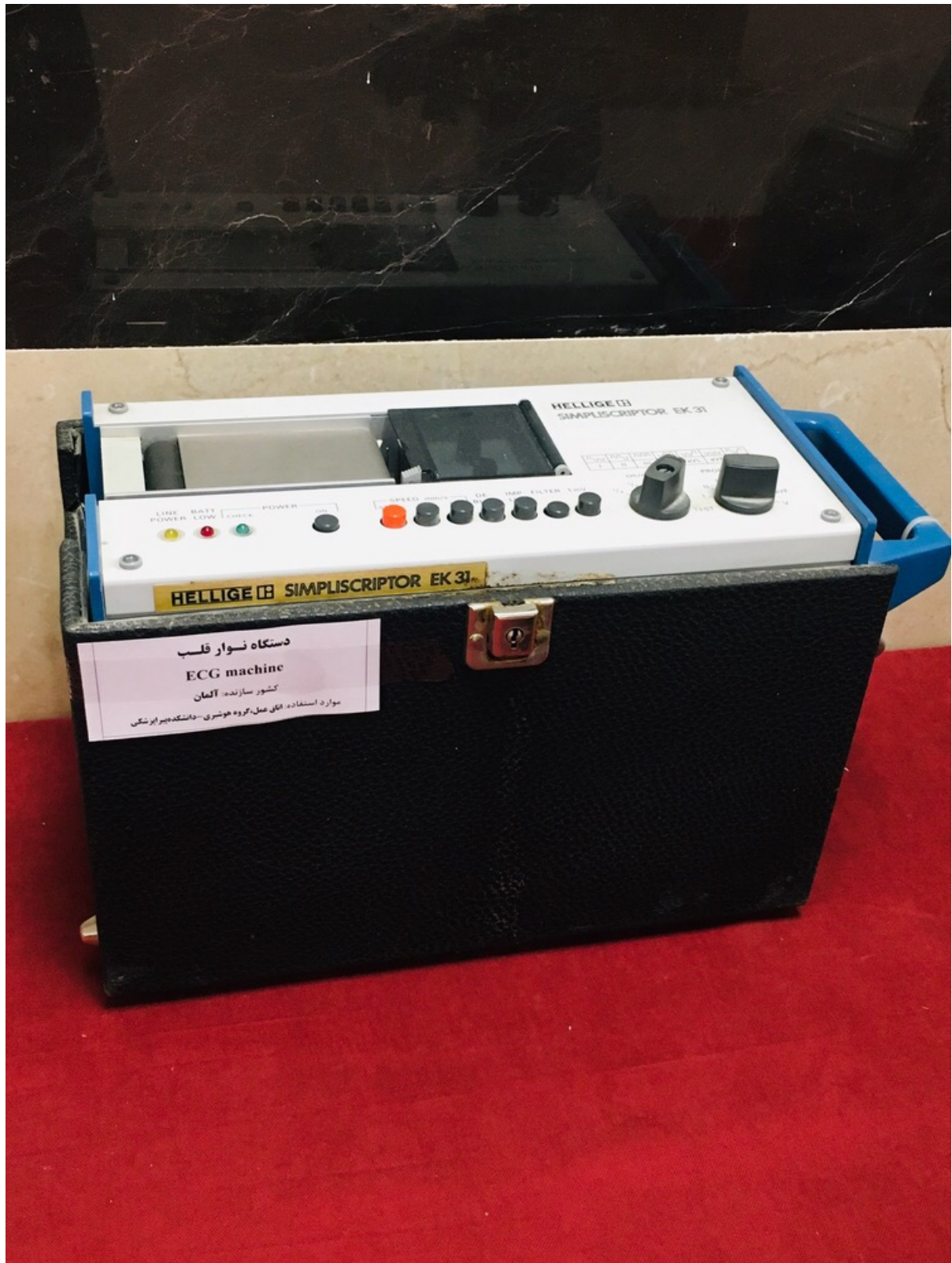
دستگاه نوار قلب