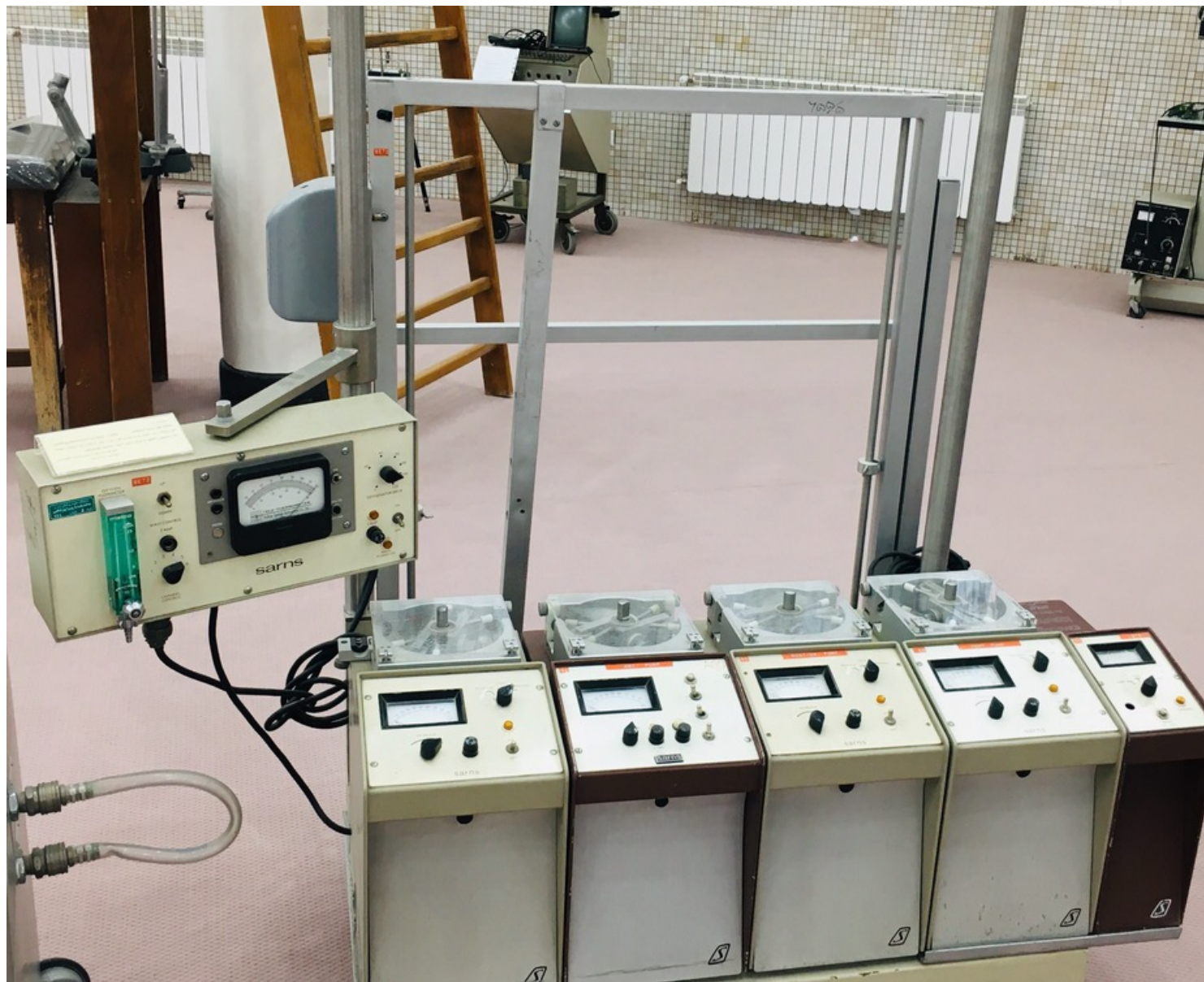
دستگاه قلب و ریه مصنوعی